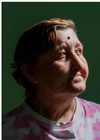
Hahn+Hartung, Moldawien 2023, aus der Serie „Gattenmörderinnen: Geschichten vom Überleben“ ©Hahn+Hartung