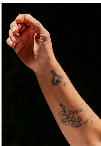
Hahn+Hartung, Rumänien 2022, aus der Serie „Gattenmörderinnen: Geschichten vom Überleben“ ©Hahn+Hartung