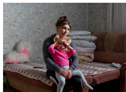
Hahn+Hartung, Moldawien 2022, aus der Serie „Gattenmörderinnen: Geschichten vom Überleben“