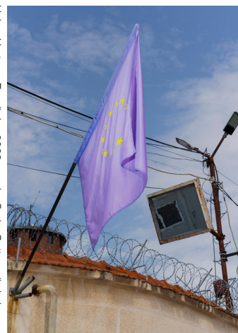
Hahn+Hartung, Rumänien 2022, aus der Serie „Gattenmörderinnen: Geschichten vom Überleben“ ©Hahn+Hartung