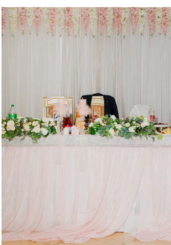
Hahn+Hartung, Moldawien 2022, aus der Serie „Gattenmörderinnen: Geschichten vom Überleben“